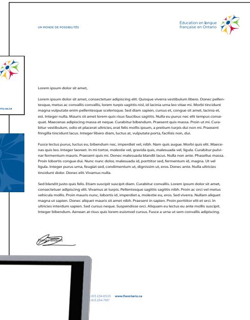
En-tête de papier à lettres