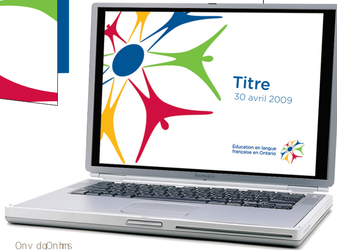
Onv d q 0 n h m s

Dm s' sd ž e d ž o ' o h d q ž ž d s s q d r